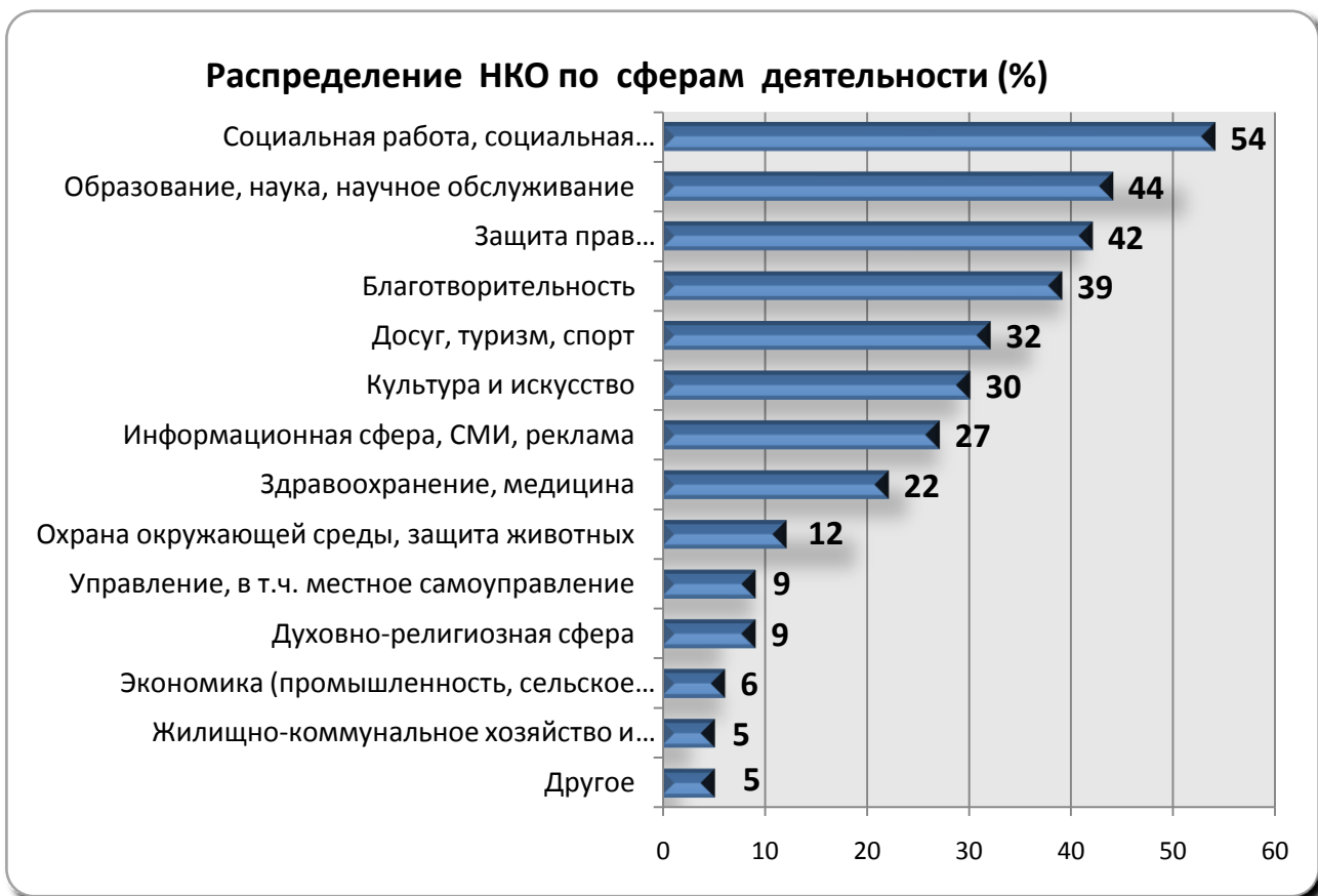
Рисунок 1. Распределение некоммерческих организаций по сферам деятельности (%) [2].

Проведённый в Курской области в 2009 г. мониторинг состояния гражданского общества подтверждает данные общероссийских исследований. Более половины респондентов уверены, что гражданское общество в России скорее не сформировано.